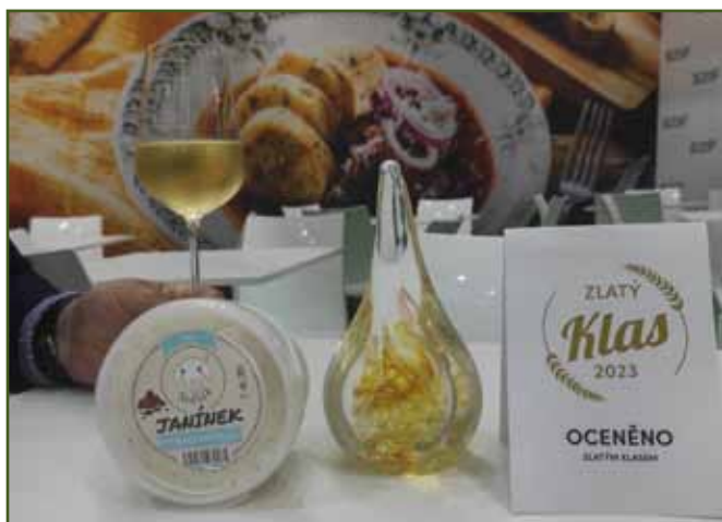
JANÍNEK, tvarohový krém s příchutí stracciatella

Kozí farma Sedlákových ze Šošůvky na Blanensku získala prestižní ocenění Zlatý klas za tvarohový krém JANÍNEK s příchutí stracciatella. Gratulujeme!