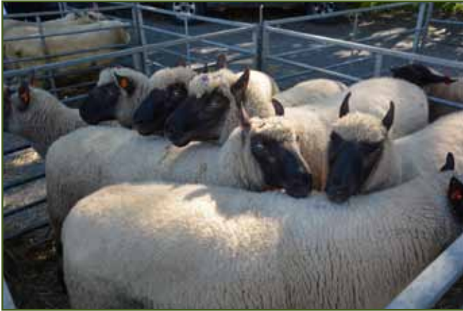
Berani clun forest Filipa Ševčíka