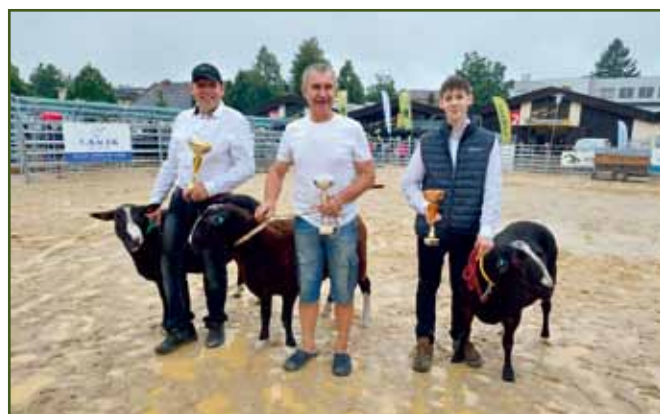
Zmoklí, ale šťastní vítězové