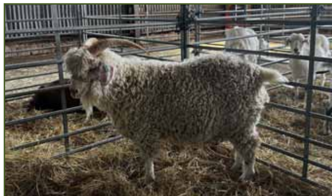
Mohérový kozel paní Plškové - šampion kozel