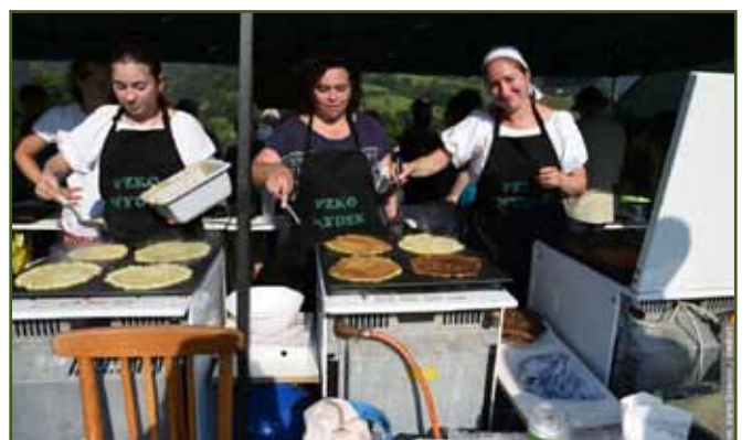
Tak se pečou placky