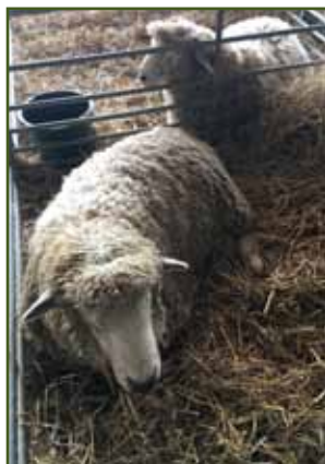
Beran romeny ze Sušárny Pohořelice