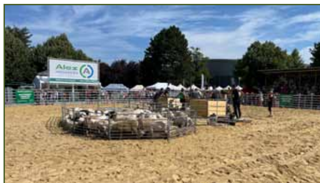
Šampionát rychlostní stříž ovcí