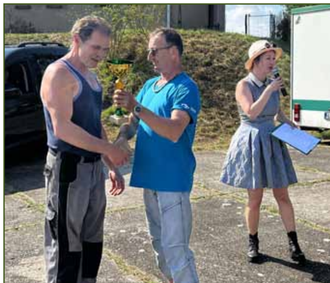
Oveka a.s. - šampionka masných plemen