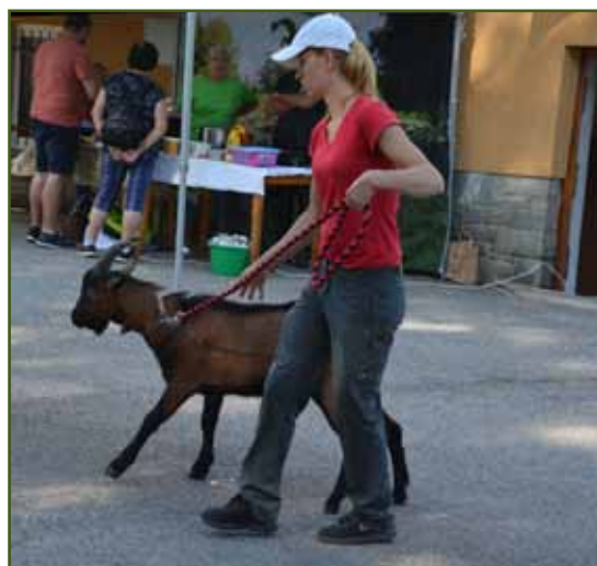
Předvádění kozlů v pohybu