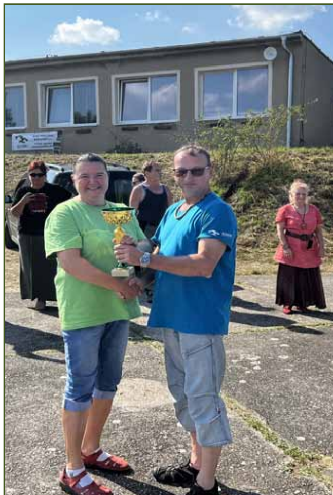
Sušárna Pohořelice - šampion ostatních plemen