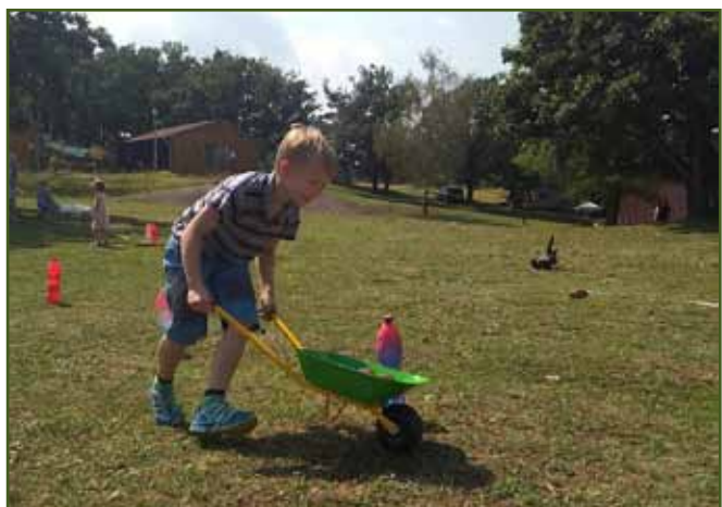
Pěkně vybrat všechny zatáčky