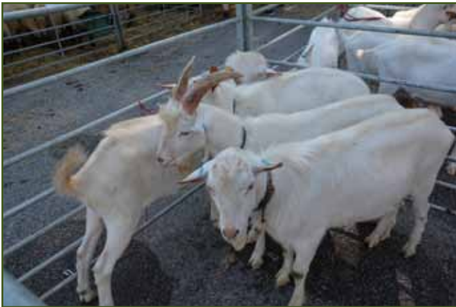
Bílí kozlíci Simony Silberové