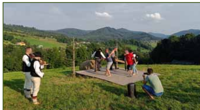
Zbojnický tanec stříhačů