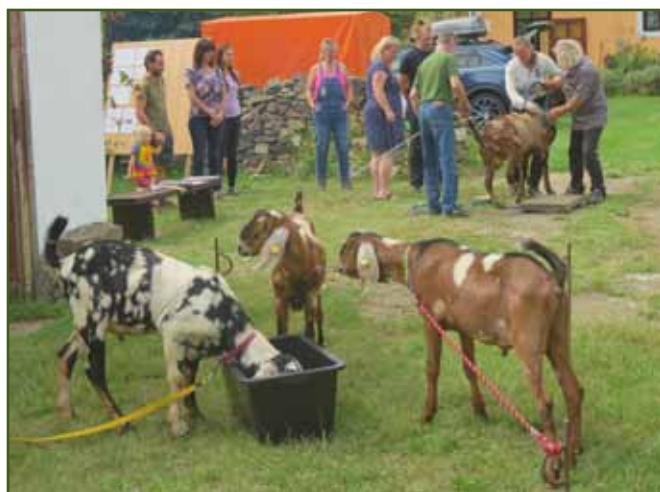
Všichni v akci

Atmosféra v Modleticích mě vždycky přivede ke vzpomínce na „staré trhy“ v Litomyšli, na Boušíně... kde se chovatelé sešli, oklasifikovali, dali si nějaké jídlo, poseděli a popovídali. Inu asi ta hodina času měla jinou hodnotu než dnes. To bezesporu, ovšem také je možné, že lidé dávali přednost jiným hodnotám, než jen prostému přepočtu na koruny nebo vykonanou práci. Proč se po dvou, třech letech dívat na starého kozla, jestli se jeho hodnocení bude podobat tomu prvnímu? Dráž se proto neprodá a žádná další dotace už kvůli tomu nepříjde. Je to tak nějak „z podstaty“. Z podstaty šlechtění, které je na hony vzdálené pouhému množení a prodávání.