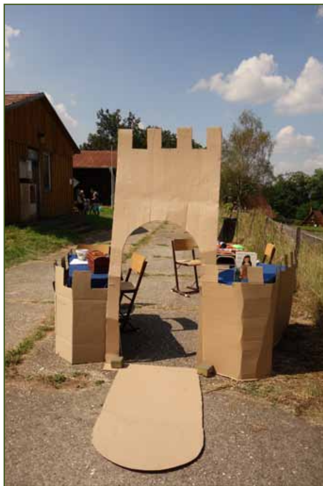
Vítejte na loupežnickém hradě!

„Nelekni se, Birku,“ řekla Ronja. „Teď přijde můj jarní křik!“