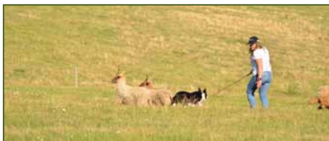
Lucie Reisnerová a Trip při úspěšném oddělení 2 ovcí