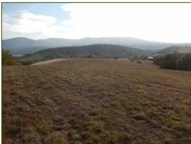
Suchem vyprahlý travní porost

Po vydatných srážkách mohou po sklizních vzniknout místy koleje od strojů. Tyto je důležité zaválet lučnými válci dřívě, než půda zcela vyschne. Zabrání se poškozování techniky při následné sklizni a zahlinění sklizené píče.