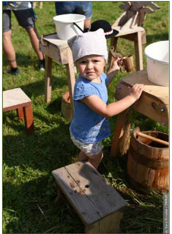
Dejte mi žinčicu!