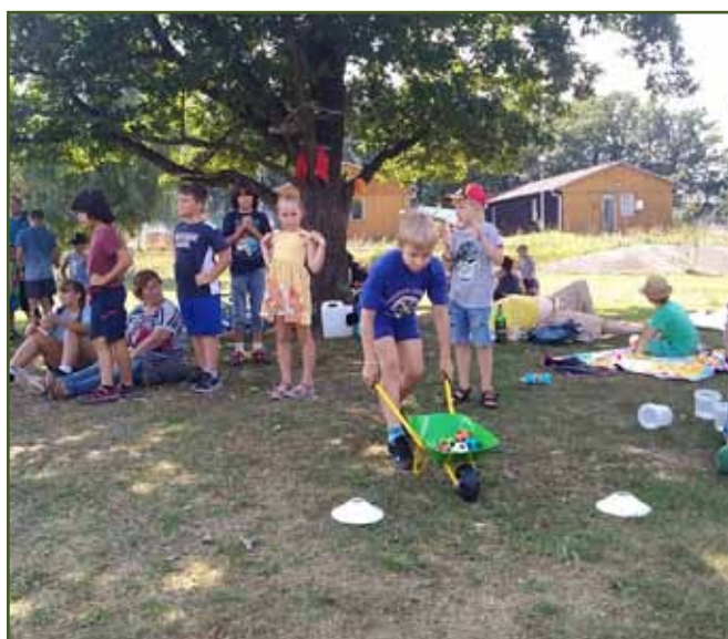
Víceboj - připraveno na startu, pozor, ted'