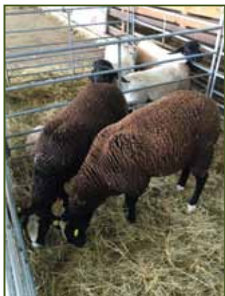
Zwartbles Ing. Hoška - šampionka ostatních plemen