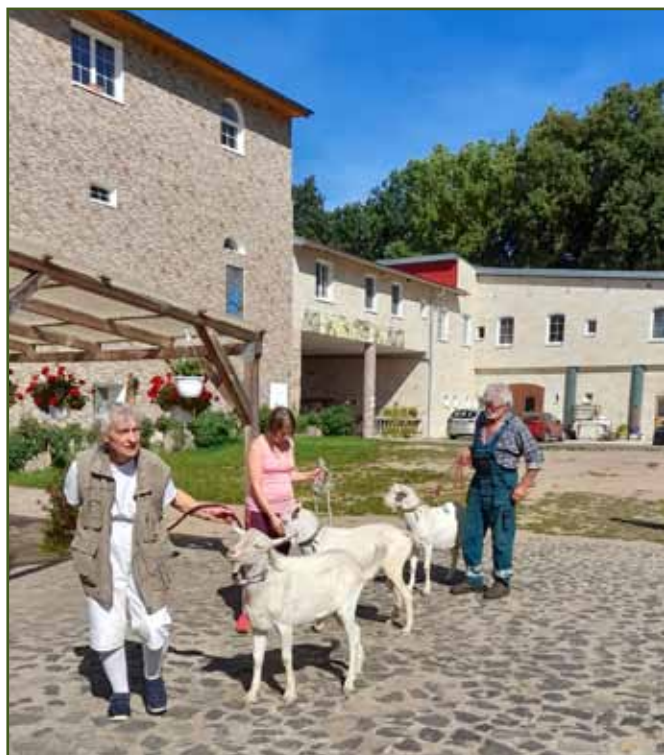
Výběr šampiona plemene koza bílá krátkosrstá

Kolekce kozlů byla velmi vyrovnaná, vynikala dobrými pohlavními výrazy, pěknými tělesnými rámci s dobrým osvalením.