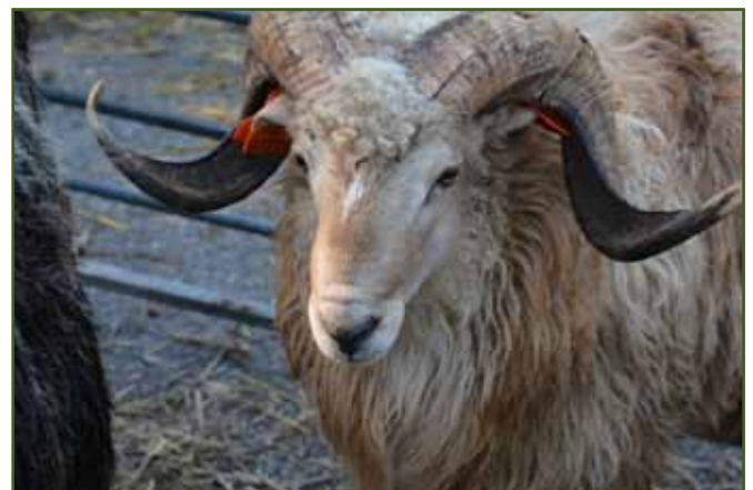
Valašský beran Lumíra Kuchaříka