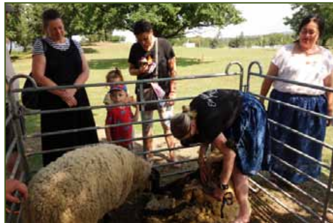
Ruční stříž v podání mladé Goralky