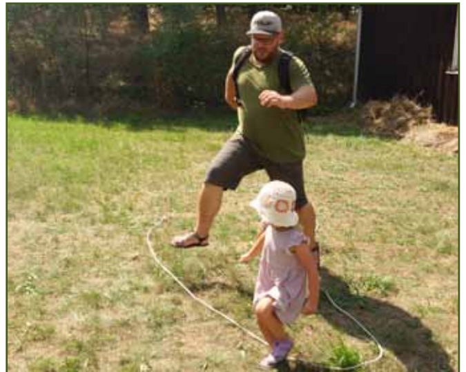
Skok přes Pekelnou tlamu