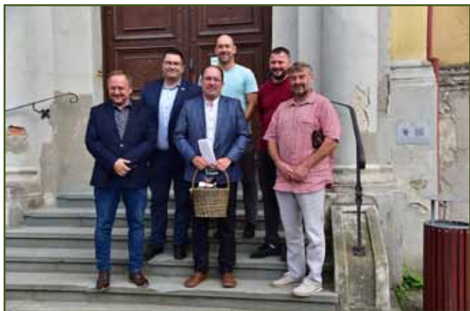
Schůzka ministra zemědělství se zastupiteli města Jablunkova