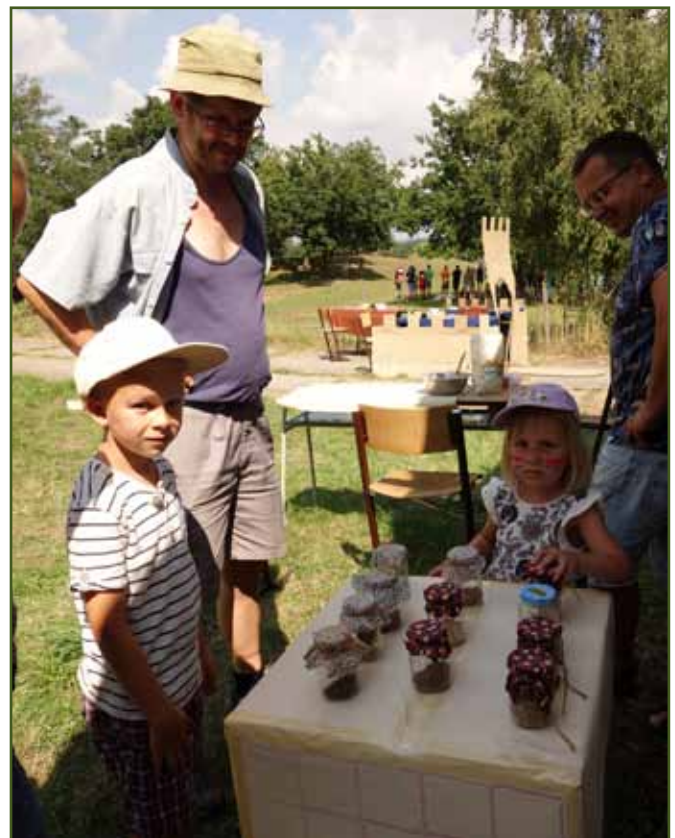
Vyznáš se v kuchyni?