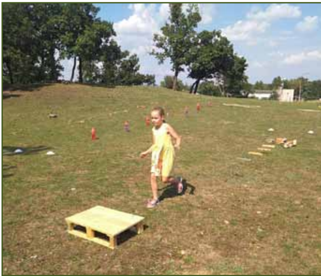
... k cílové rovince