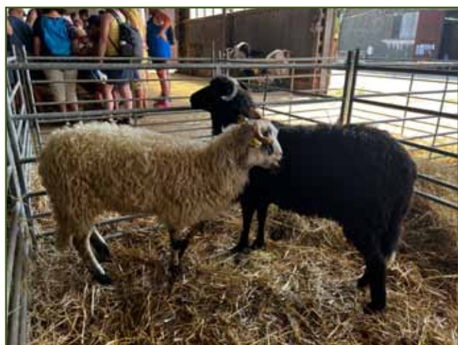
Valašky ze Stránského - nejlepší kolekce ovcí 1. místo