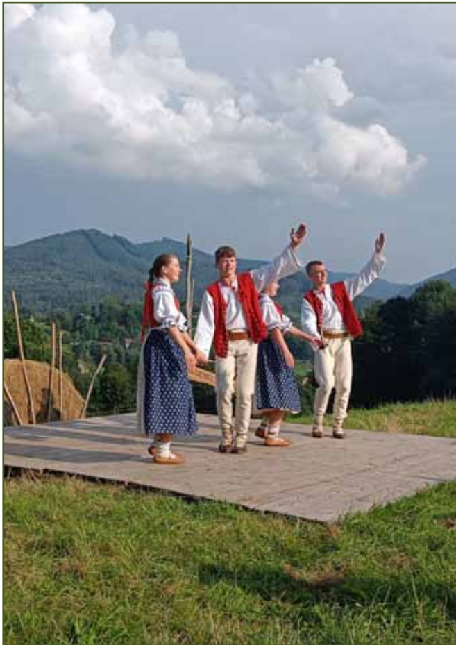
Tance z moravského Valašska