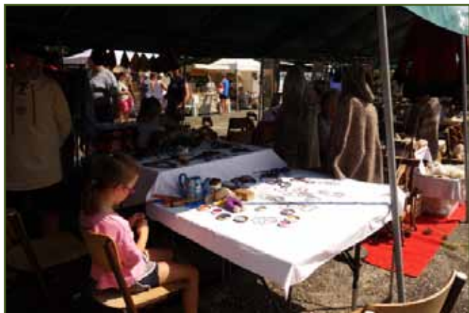
Drátěná dílna pro děti