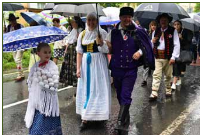
Nedělní průvod městem