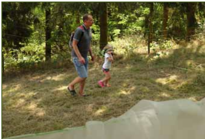
Hustá mlha, vůbec nic nevidím...