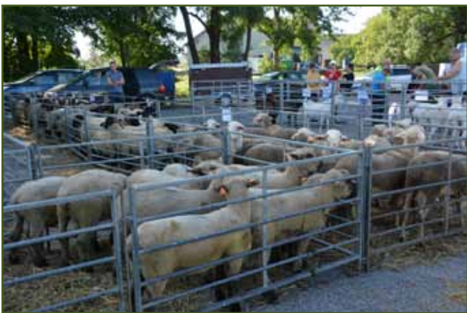
Nákupní trh v Podvihově