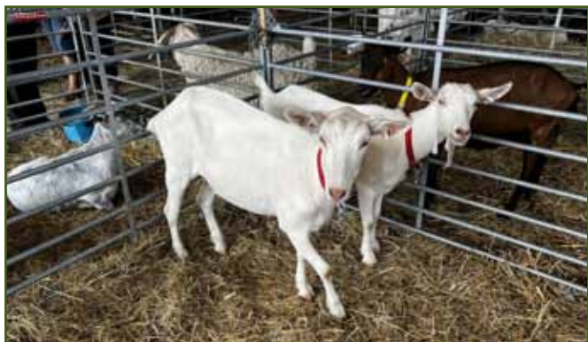
Bílé kozy Pavla Kubeše - nejlepší kolekce koz