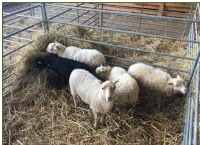
Quessantské ovce Pavla Růžičky