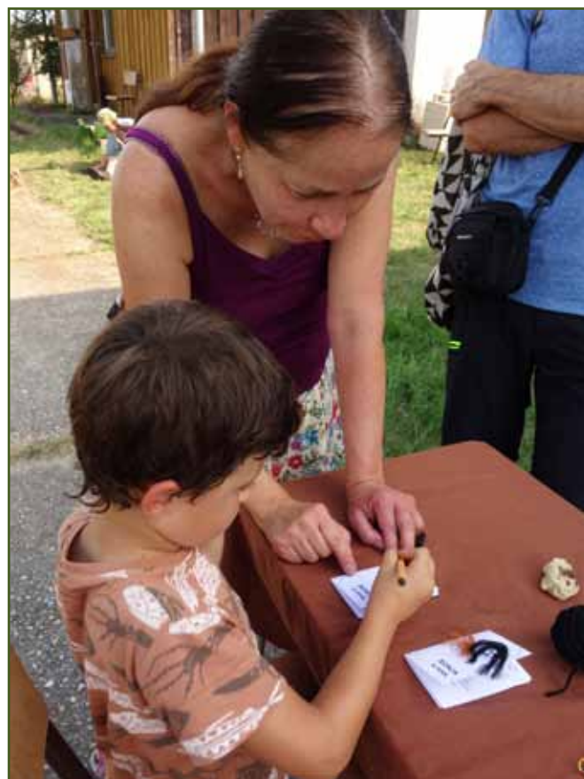
Miniknižka s originální obálkou