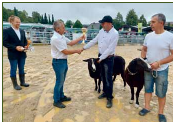
Předávání poháru vítězi