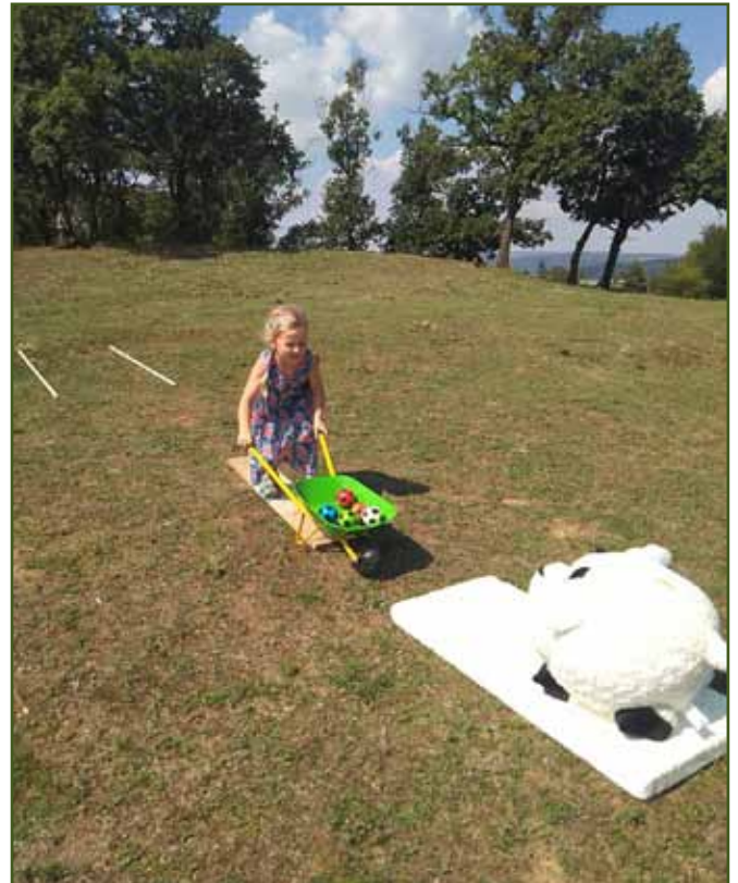
Už jsem u ovečky