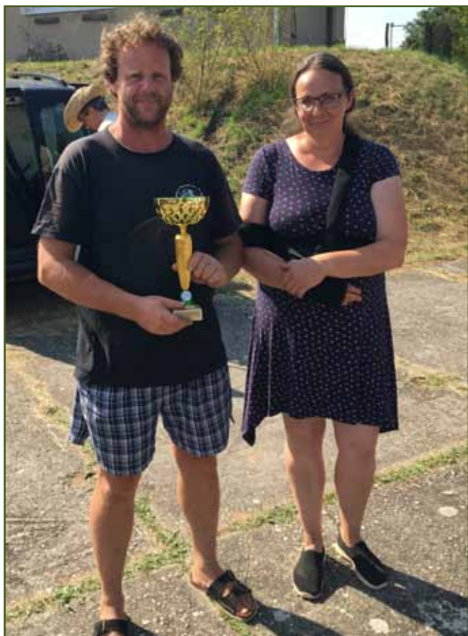
Stránské z.s. - nejlepší kolekce ovcí 1. místo výstavy