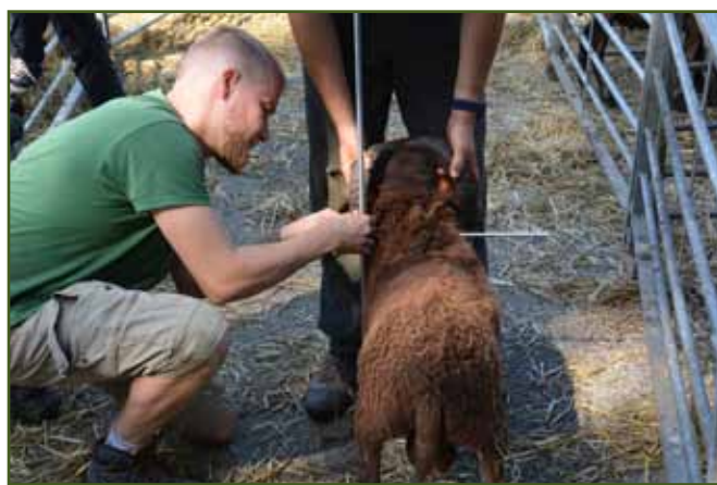
Měření kohoutkové výšky ouessantského berana