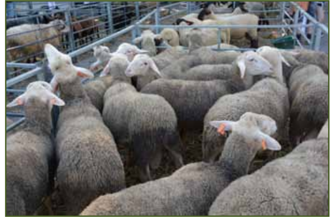
Berani lacaune Jiřího Prokeše