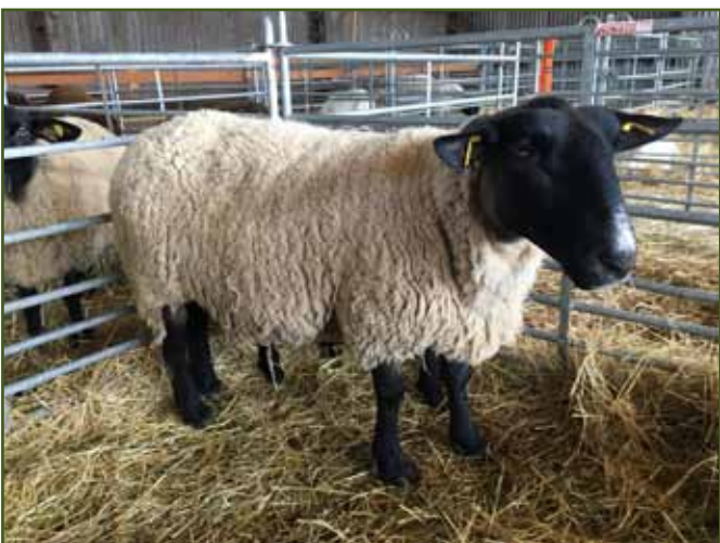
Bahnice suffolk firmy Oveko - šampionka masných plemen