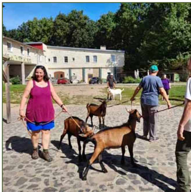
Výběr šampiona plemene koza hnědá krátkosrstá