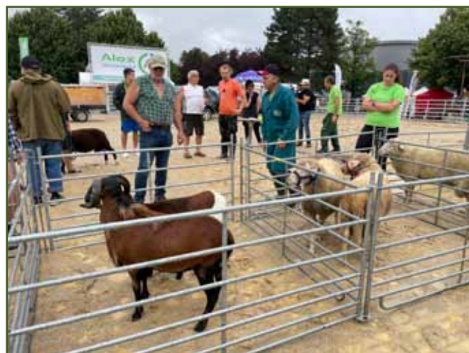
Kamerunští a šumavští berani