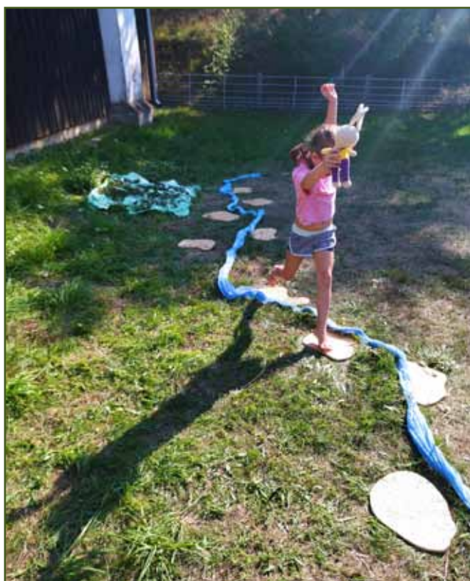
Pozor, ať nepadneš do řeky!