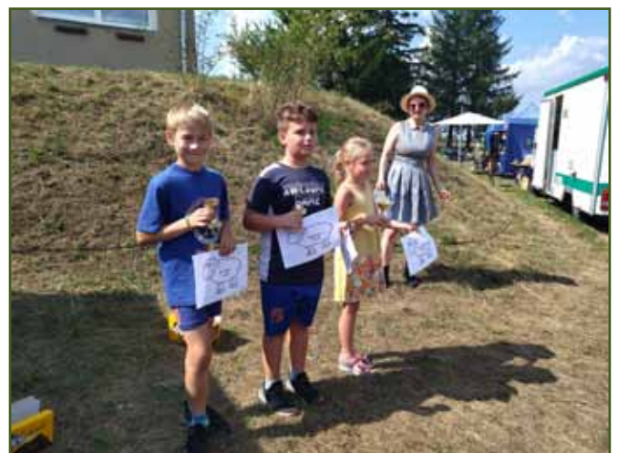
Vítězové - gratulujeme!