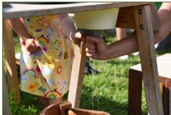
Už to teče