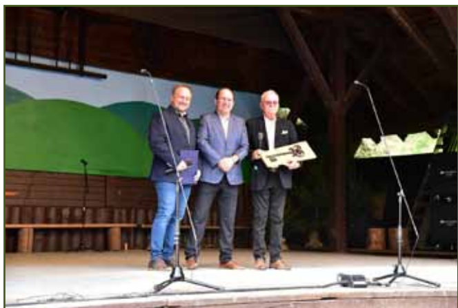
Slavnostní zahájení za účasti ministra zemědělství Mgr. Marka Výborného