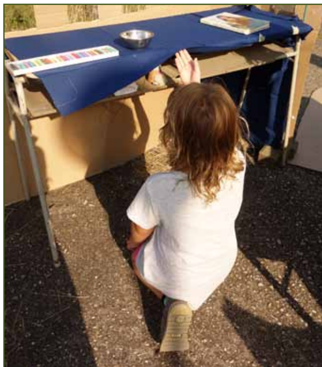
Skřítku, něco ti pošeptám