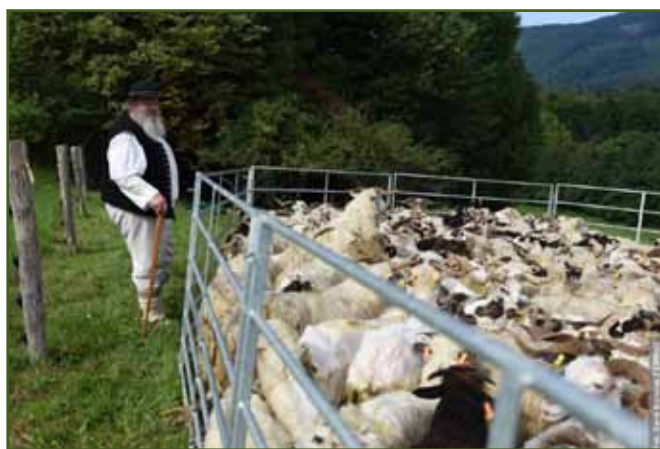
Netlačte se, nebo tam vlezte!