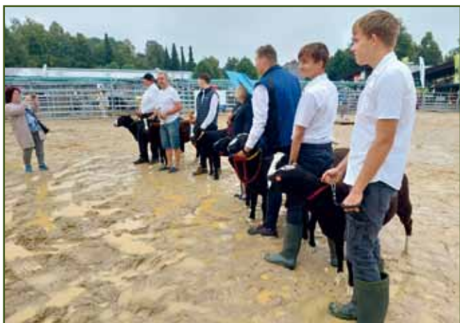
Vyfocení při focení