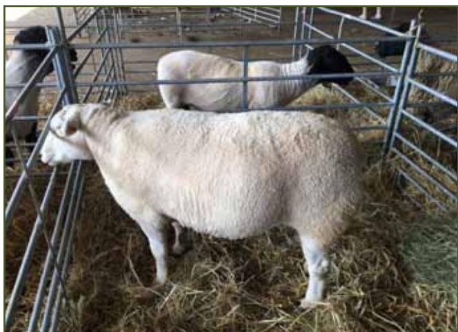
Berrichone du Cher Josefa Pašty - šampion masných plemen