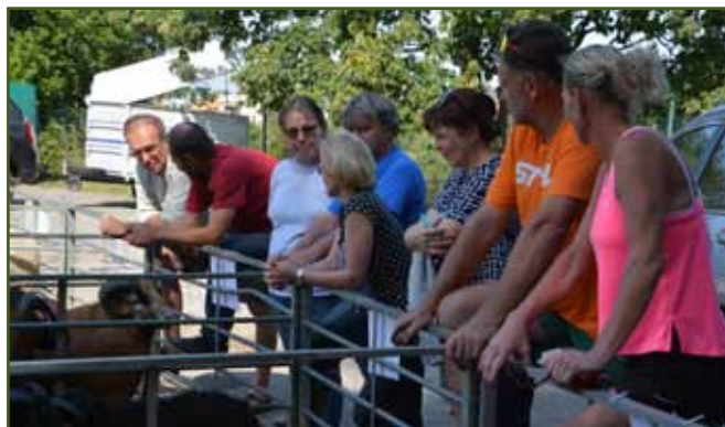
Trpělivé obecenstvo hodnocení zvířat