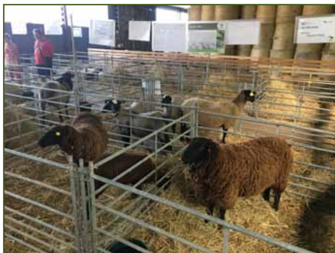
Pohled na výstavu ovcí a koz

V rámci ovčáckých slavností Ovenálie Zlobice se tradičně konala i celostátní výstava ovcí a koz. Spolu s výstavou proběhl nákupní trh beranů a kozlů. Katalog kozlů čítal na 11 kusů, kde zastoupenými plemeny byla koza hnědá krátkosrstá, koza bílá krátkosrstá, burská koza, mohérová koza a kašmírová koza. Všichni předvedení kozlíci splnili váhové limity a nevykazovali výrazné vady exteriéru, tudíž byli úspěšně zařazeni do plemenitby. Do katalogu beranů bylo přihlášeno 8 beranů, ale nakonec byli k hodnocení připraveni 4 berani plemen merinolandschaf, romney a východofříské ovce, kteří prošli klasifikací, kde nejnižší třída za exteriér byla elita.