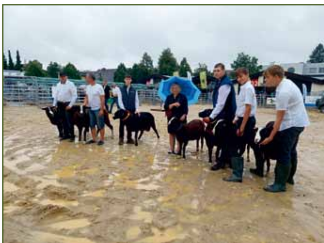
Zahájení testu náhrady buvolů berany zwartbles při sázení rýže...

Na letošní ročník chovatelky a chovatelé zwartblesů přihlásili celkem sedm beranů a všichni se s nimi i dostavili. Podobně jako vloni, i letos byli předvedeni čtyři berani stejní jako na předchozím ročníku. Je tak zajímavé sledovat, jak se berani vyvíjí, dospívají a dokončují tělesný růst. Bohužel, v kapkové tísní jsme letos nenavázali s měřením a vážením beranů, proto chybí srovnání kohoutkových výšek a aktuálních živých hmotností.