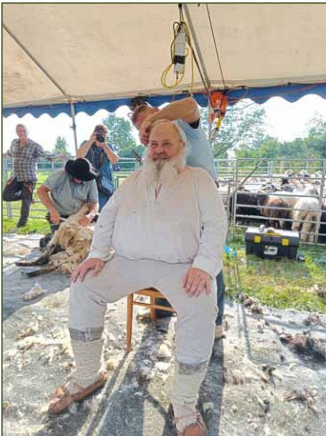
Stříhaly se nejen ovce