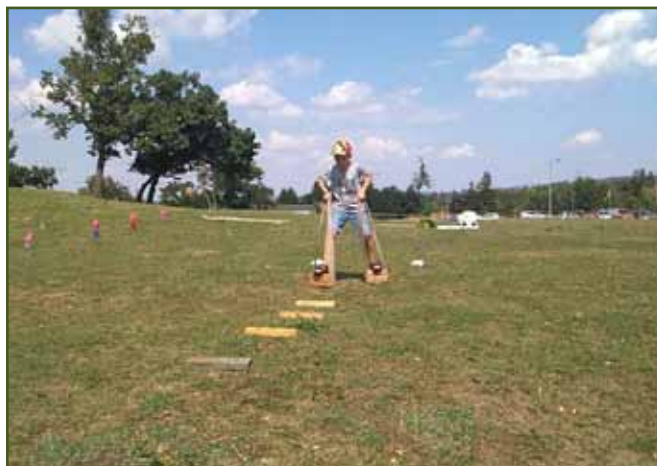
Levá chůda, pravá chůda, levá...