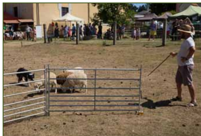
Ukázka pasení se psem