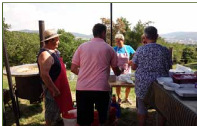
Ovčácký kotlík a jiné dobroty

Na volné ploše před Kolibou mohli návštěvníci mimo stanu s přadlenkami navštívit také stánky řemeslníků. Nechyběli výrobci a prodejci specialit z kozího nebo ovčího mléka.