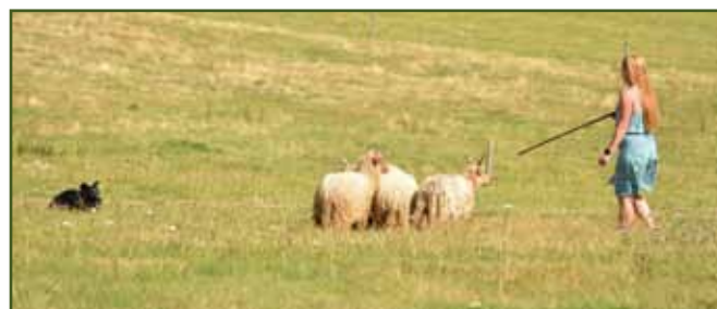
Tereza Leciánová a Rou se chystají na dělení