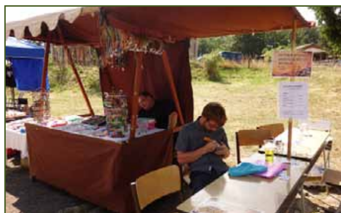
Dílna broušení do skla

Všem zúčastněným, malým i velkým, blahopřejeme k úspěšnému zdolání všech disciplín a gratulujeme vítězům.