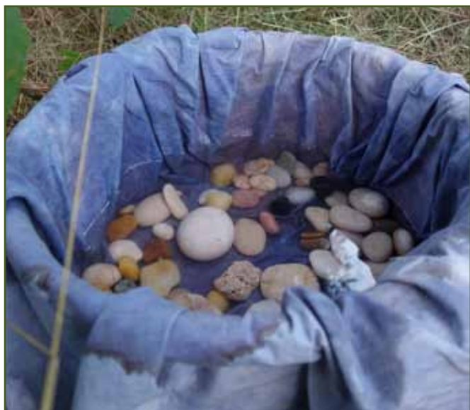
...ted' ke studánce pro vodu

Toto se tedy odehrávalo mezi sruby a cestou k rozhledně. Děti si však našly zábavu i jinde. Na pastvině se mohly svést na koni, v Kolibě namalovat sádrovou figurku, pod stanem na hlavní ploše nalézt různé tvořivé dílničky u vlnářek, mistra dráteníka, korálkářů či brusiče skla. A těch dobrot, které voněly z Koliby! Zelňačka, řízek či hamburger; speciality z ovčích a jehněčího jako guláš, nožky, svíčková či pečené s omáčkou; samozřejmě venkovní ovčí kotlík a halušky s brynzou, uzený bůček a klobásy přímo z udírny i něco sladkého k zakousnutí... K vidění samozřejmě ovečky a kozy, stříhání ruční i strojkem, ovládnání ovcí pomocí ovčáckého psa... jen být v pravém čase na pravém místě.