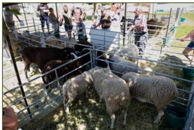
Výstava ovcí a koz v areálu farní zahrady