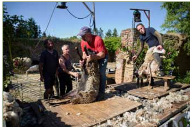
Speed shear Nepomuk 2023

V sobotu 15. 7. se v Nepomuku na jižním Plzeňsku konal již druhý ročník Ovčáckých slavností. Akce stejně jako v předchozím roce byla nabita bohatým chovatelským programem. Kromě krajské výstavy ovcí a koz byla pro návštěvníky připravena i výstava drobného zvířectva ve spolupráci se ZO ČSCH v Kasejovicích. Dále se zde konala vesnická olympiáda, ukázky práce ovčáckého psa se stádem ovcí. K vidění bylo zpracování ovčí vlny. Po celý den byly v nabídce pochutiny nejen z jehněčího masa a sýrů, ale i jiné regionální potraviny. V areálu byly stánky partnerů např. s nabídkou krmiv, softwaru pro chovatele atd. Hlavním lákadlem pro diváky však byla napínavá soutěž stříhačů ovcí. Škoda jen, že účast byla silně poznamenána