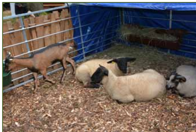
Kolekce mladých ovcí a kozy zaujala zejména malé návštěvníky