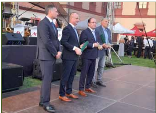
Slavnost předání ceny Zlatý klas