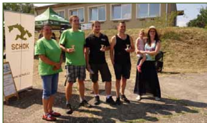
Vítězové vidláckého víceboje