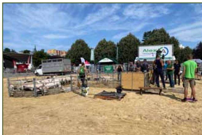
Šampionát rychlostní stříž ovcí - příprava na další kolo